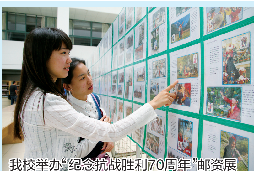
我校举办“纪念抗战胜利70周年”邮资展

为纪念抗战胜利70周年,近期我校党委宣传部推出了“纪念抗战胜利70周年”的主题系列活动。作为该系列活动首场活动——邮资展览进校园,5月6日在高校园区图书馆揭幕。