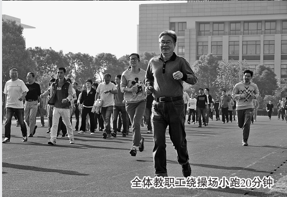
全体教职工绕操场小跑20分钟