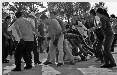
▲人文社科学院的老师们在参加集体项目的比赛