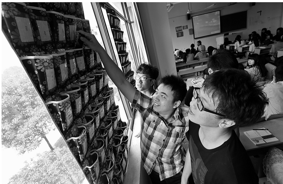
上课之前,工商企业管理1332班的同学将手机放进收纳袋,无手机进入课堂。

那到底无手机课堂建设怎么建、建得怎么样、在建设过程中有哪些问题和困惑呢?带着深深的疑问,笔者走访了有关师生——