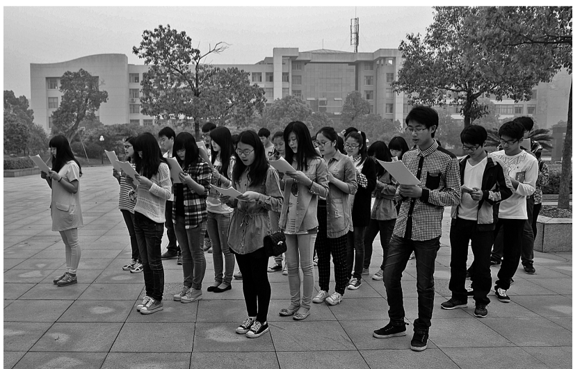
好“三风”建设开展以来,校园学习风气明显好转。图为早上6时多,管理学院30多名青年学子和其他学院的学生一样,自发组织来到校园,整齐地排好队,进行早读。