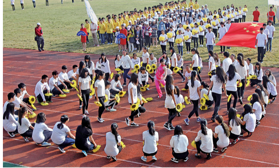
经贸学院队在表演“向日葵”入场舞蹈