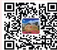
台州院官方微博二维码

潘书记强调,作风建设没有休止符,要抓紧抓细抓实。学校领导和中层干部要以身作则,严格要求,花更多时间深入师生,深化学校“好三风”建设。要积极探索学校党建工作新形势和新任务,不断探索学校党建工作新思路和新举措,全面推进我校党建工作取得新成效。