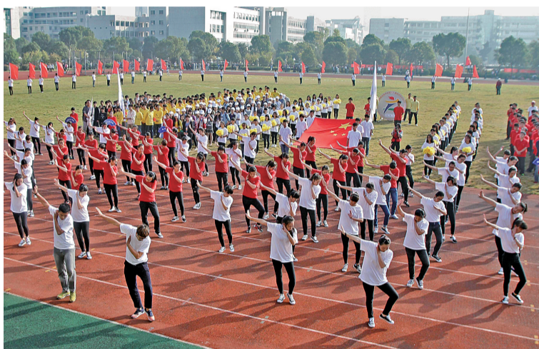
艺术学院选择了“脍炙人口”的歌曲“小苹果”为他们的入场舞蹈

18个代表队1050名运动员参加61个项目,5人次打破3项校记录 艺术学院、管理学院、生化学院获团体前三名 管理学院、机电工程学院获“体育道德风尚奖”